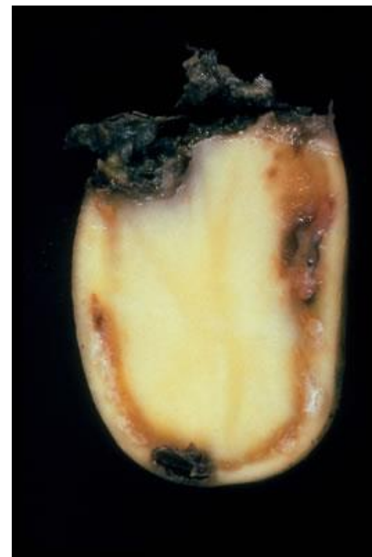
Fot. 1. Przekrój przez porażoną bulwę z zamierającymi wiązkami przewodzącymi

bakteria wywołująca chorobę ziemniaków zwaną śluzakiem (brązową zgnilizną lub brunatną zgnilizną ziemniaka)