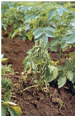
Fot 1 i 2. Wędnące rośliny ziemniaka